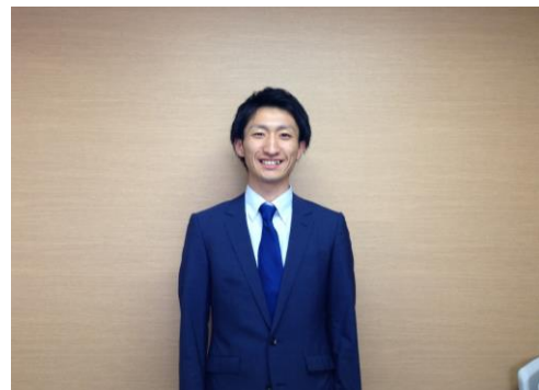
編集担当 遠藤 洋輔

このように時代とともに楽しみ方や、中身そのものが変わってくる事が他にもたくさんあるのではないのでしょうか。時代の流れに取り残されることなく、進んでいきたいものですね。