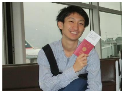
編集担当 遠藤 洋輔