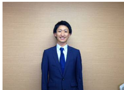
編集担当 遠藤 洋輔

日本ではサングラスをかける慣習はありませんが、紫外線対策として、サングラスデビューをしてみたいはいかがでしょうか。