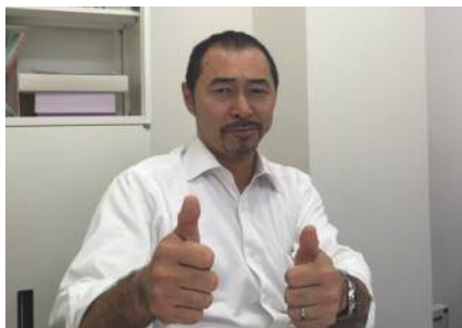
株式会社 日吉 日吉社長

一番の苦勞は、資金繰りでした。当時は30歳で借金が1億くらいありました。当然、運転資金も回らない状況に陥り、お金をかき集めなくてはいけなくなり、金勘定ばかりやるようになっていました。そうすると、どんどん視野が狭くなり、自分の手の上にあるものしか見えなくなって、その上でなんとかしようと、そればかり考えていました。そんな考え方は自分では嫌だと思っていたのですが、追いつめられて、思考能力が働かない状況に陥っていました。保険金があれば迷惑が掛からないと思い、本気で自殺を考えた事もありました。そんな中で当時紹介された労務士の先生にお話しをしたところ、怒鳴られて、明日朝一で銀行に土下座して回って、それが終わったら、従業員に土下座して給与をカットするようにと言われました。次の日、銀行を回り、従業員に土下座をして、その後の数年はとてもしんどかったです。