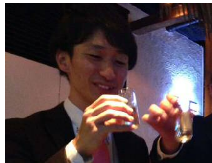
編集担当 遠藤 洋輔

とは言うものの、やはりバレンタインデーに女性からのチョコレートは期待してしまいます。男の性なのでしょう。バレンタインデーまで、ドキドキしながら待っていたと思います。(笑)